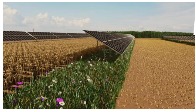
Beispielhafte Darstellung der geplanten Agri-Photovoltaik Solarfelder

Darstellung als Sonderbaufläche PV mit hohem Grünanteil. Die Teilflächen, auf welchen Agri-PV-Anlagen errichtet werden, sollen weiterhin als landwirtschaftliche Nutzfläche dargestellt werden.