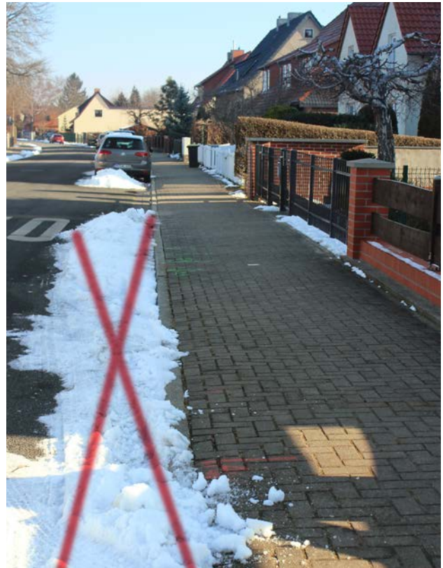
Das ist falsch! Bei Tauwetter Rinnstein/Gosse frei halten.