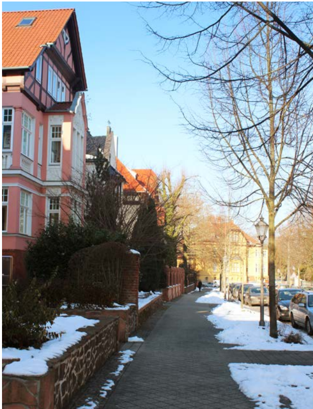
Gehweg durchgängig geräumt und regelmäßiger Zugang zur Fahrbahn.