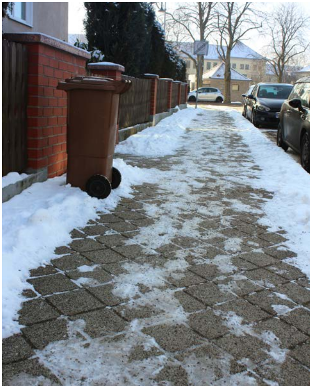
Bei vereisten Gehwegen Sand, Splitt oder Granulat streuen!