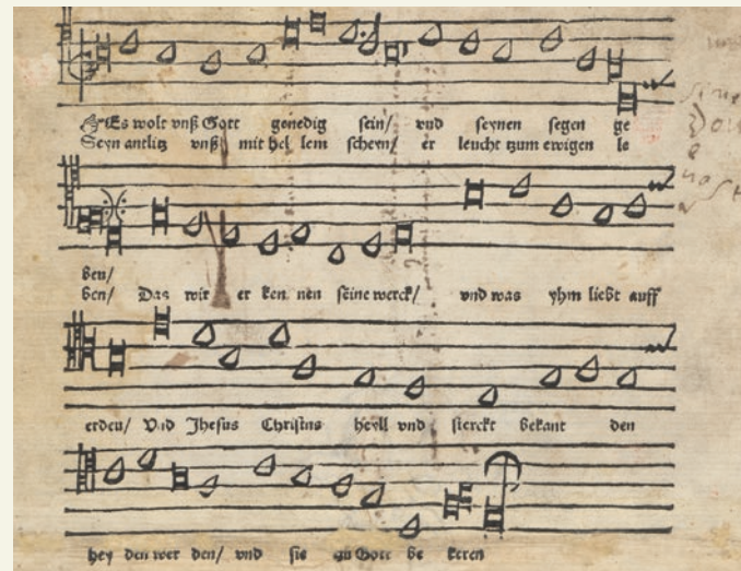
Magdeburger Druck eines Lutherchorsals, der am 6. Mai 1524 zu einem Tumult auf dem Alten Markt führte | Der Lxvj. Deus Misereatur [...] , Magdeburg: Hans Knappe 1524, © SPK-Staatsbibliothek zu Berlin

ACHTUNG! DER FESTVORTRAG FINDET IN DER JOHANNISKIRCHE STATT.