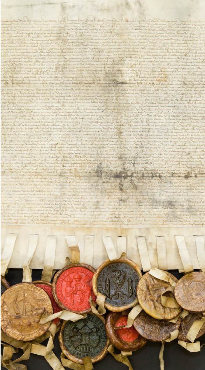
Neu im UNESCO-Weltdokumentenerbe und am 5. Mai 2024 im Alten Rathaus zu sehen: Schutz- und Beistandsvertrag (Tohopesate) vom 31. Oktober 1476 © Stadtarchiv Braunschweig, A I 1: 885 (Ausschnitt)